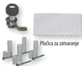
Pločica za zatvaranje

Element za pričvršćivanje na zid od gipsa