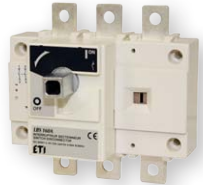
LBS 160 3P